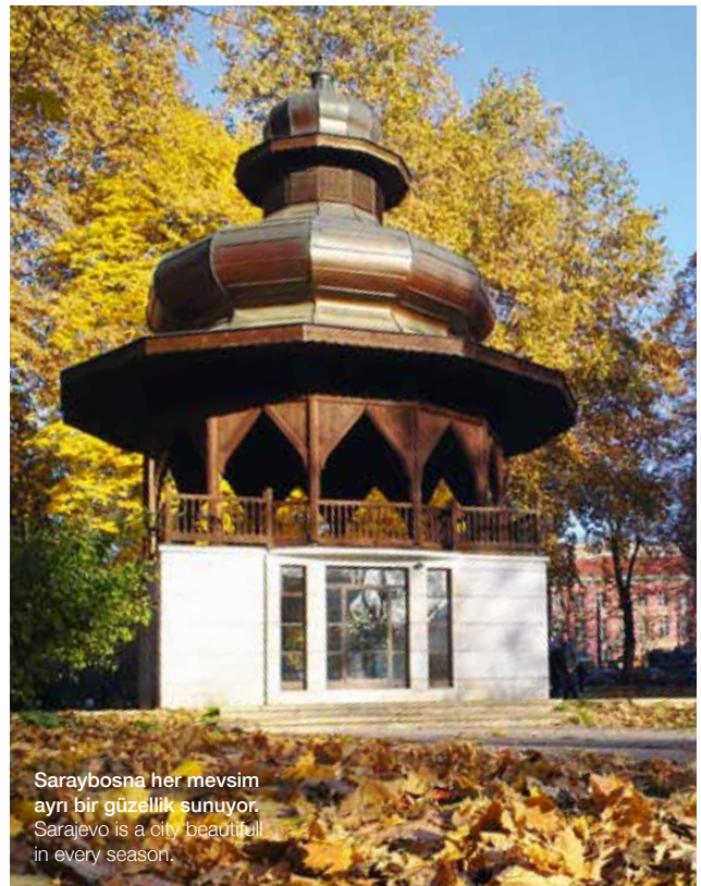
Saraybosna her mevsim ayn bir güzellik sunuyor. Sarajevo is a city beautiful in every season.