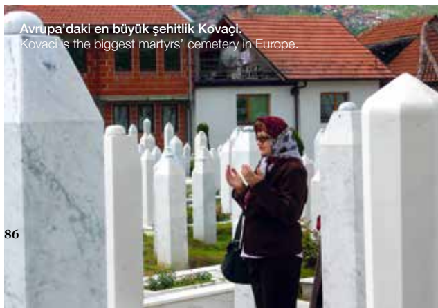
Avrupa'daki en büyük şehitlik Kovaçi. Kovaci is the biggest martyrs' cemetery in Europe.