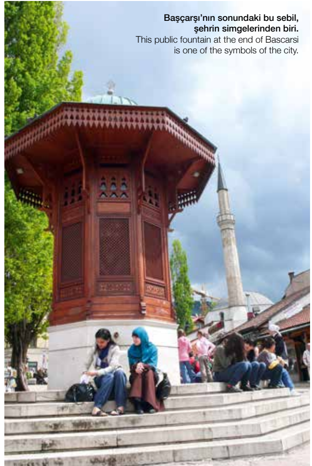
Başçarşı'nın sonundaki bu sebil, şehrin simgelerinden biri. This public fountain at the end of Bascarsi is one of the symbols of the city.